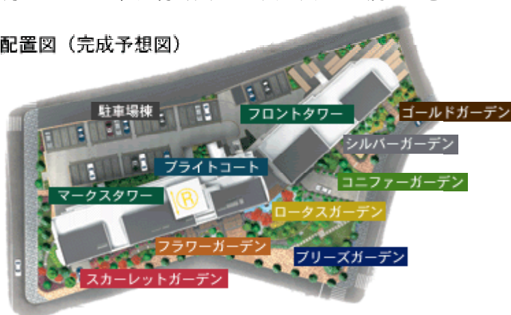
敷地配置図（完成予想図）

公開空地には樹木・草花の種類や形状の異なる 7 つの庭をコーディネートし、ナチュラルな環境を創出。住まう方はもちろん、道行く人にもみずみずしい潤いを感じさせる庭としました。