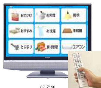
デジタルテレビでの操作画面