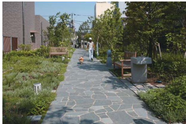
雑木林の路地（路地の再生）