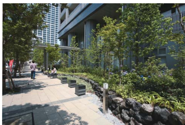
涼の庭（自然な趣をもつ沿道空間）