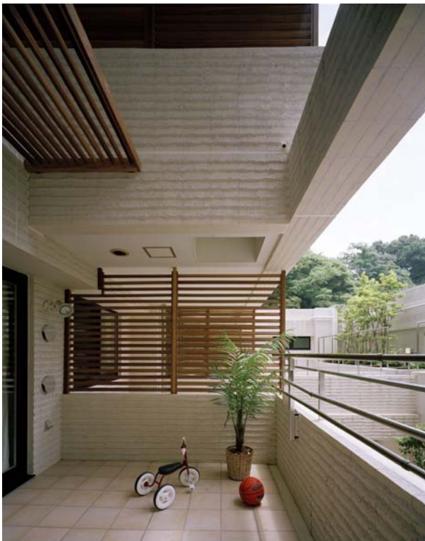
二層吹き抜けのバルコニー