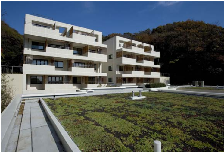
屋上緑化（南棟）と北棟