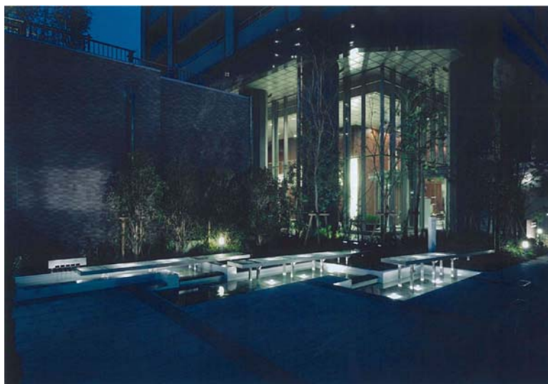
月見の棧橋のオブジェ（記憶の継承）