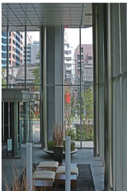
ロビーから街並みを望む（街の連続性）