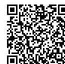
「沖縄に暮らそう」 モバイルサイト用 QRコード