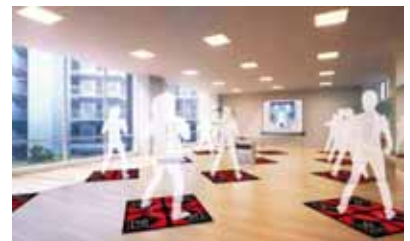
グランスタジオ（共用棟2階）

また、同じく共用棟内の「グランスタジオ」には、コナミスポーツのデジタルスタジオプログラム「KONAMI GROOVE MOTION DDR」を導入。スクリーンに表示されるインストラクター画像に合わせて全身運動する、新感覚のスタジオプログラムです。ウエストに装着した無線式センサーで動きをリアルタイムにチェックし、評価・得点・消費カロリーを算出するので、楽しみながらエクササイズできます。