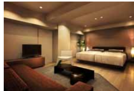
ゲストルーム（A棟1階）