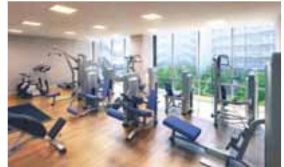
グランジム（共用棟2階）

共用棟に入居者専用のジム「グランジム」を設置し、世界最大級のフィットネスクラブ「ゴールドジム」推奨のマシンを導入。効果的なトレーニングを行うためのアドバイスも受けられます。