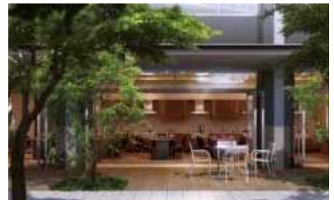
グランキッチン（共用棟1階）

さらに、入居者専用ホームページでは、「TEC 辻学園グループ・辻クッキング」監修、プロによる本格的なオリジナルレシピを配信（月1回予定）します。