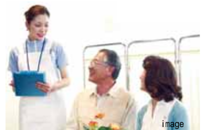
ケアプランセンター（ハートフルステーション） （A棟地下1階）

また、入居者の健康についてのコミュニケーションを図る「ハートフルステーション」としての機能も担い、日ごろの体調管理などの相談も受け付けます。