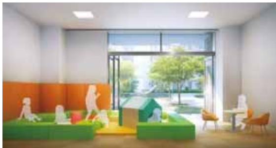
キッズルーム（共用棟1階）