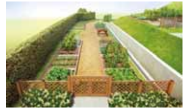
ファミリーファーム