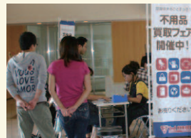
不用品買い取り受付の様子

また、2009年9月からは、大京アステージ、オリックス・ファシリティーズ、J・COMSの大京グループの管理会社3社において、不用品のマンション出張買い取りサービスを開始しました。このサービスをご利用いただくことで、居住者の方は自宅で気軽に査定を受けて不用品を処分するメリットが得られます。また、不要品の廃棄を抑制し、大切に活用する意識の向上にも結びつくものと考えております。