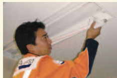
「住まいの駆けつけサービス」イメージ

2009年から新たにメニューに加えた「住まいの駆けつけサービス」は、水周りや建具等の不具合、玄関鍵等紛失、ガラスの修理・交換などにおける1次対応、および管球類の交換などに