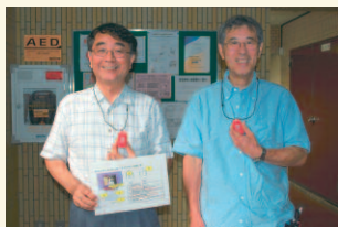
「セキュアプラス」を導入された管理組合さま。赤いペンダントは緊急通報ワイヤレス発信機

業界最多の34万戸超のマンション管理を受託する大京アステージでは、築年数の進んだ管理受託マンションを対象に、セキュリティインターホン、専有部防犯センサー、携帯ペンダント型の緊急通報監視サービスなどのホームセキュリティや、生活サポートをご提供するサービス「セキュアプラス」の提案活動を2008年から進めており、2009年9月末には約300棟・1万6,000戸に導入いただくまでに