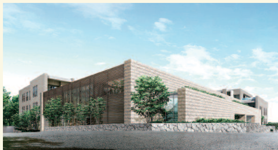
ザ・ライオンズたまプラーザ 美しが丘

「ザ・ライオンズたまプラーザ 美しが丘」(神奈川県横浜市)は、2009年5月、超長期住宅の実現に向けた提案型プロジェクトとして発売されました。同物件の大きな特長といえるのが、自然と共に暮らす日本伝統の工夫を「パッシブ」手法として取り入れた点です。「打ち水」効果を狙ったミスト散布装置、「すだれ」の知恵を活かしたグリーンカーテン設置スペース、外付けの電動ブラインドなどを導入、さらに住宅履歴書の整備など多様な取り組みも評価され、国土交通省から「平成20年度(第2回)超長期住宅先導的モデル事業」に認定されております。