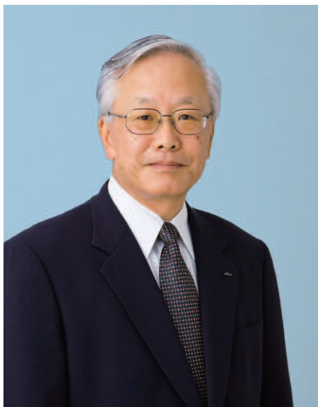
取締役兼代表執行役社長 グループCEO