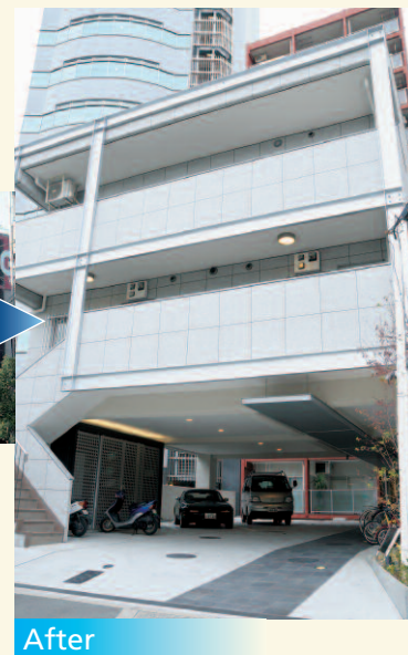
大規模修繕工事・グレードアップ工事の一例