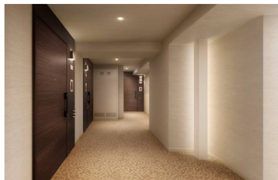
「内廊下イメージ」イメージ