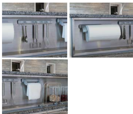
◎マグネット&吸盤付きのパーツが標準で3点付属。 (左上：5連スライドフック、右上：キッチンペーパーホルダー、左下：マルチハンガー)