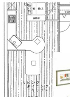
「ライオンズヴィラジオ5000」 アイランドキッチンプランの提案

5000棟記念物件で、離れや地下室付きなど個性的な間取りが提案された物件。アイランド部分に、パーティンクが設置されている。