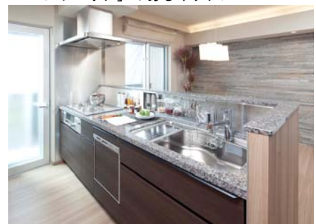
「ハンドエリア」のあるキッチン

フラットカウンター採用で、よりオープンに開放感のあるキッチンへ。食洗機を標準採用し、使用後の食器も目に触れにくい。