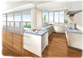
ピュアライトスタイルキッチン

バルコニー側にキッチンを選んだ「ピュアライトスタイルキッチン」、廊下の天井高を約2.37m確保した「ハイパッセージスタイル」、居室と居室の間にプライベートスペースを設けた中庭空間「インナーパティオスタイル」、3つの居室をバルコニー側に配した「トリプルオープンスタイル」