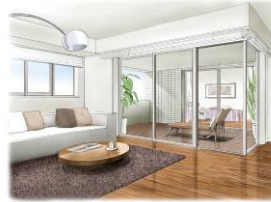
インナーパティオスタイル