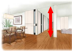
ハイパッセージスタイル