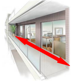
トリプルオープンスタイル