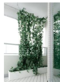
グリーンカーテン 取付け用フック（参考写真）

次世代省エネ基準最高等級「4」取得、エコガラス、エコジョーズ、グリーンカーテン取付け用フック、節水型トイレ、保温浴槽