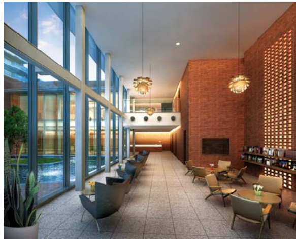
ライブラリーラウンジ 完成予想 CG