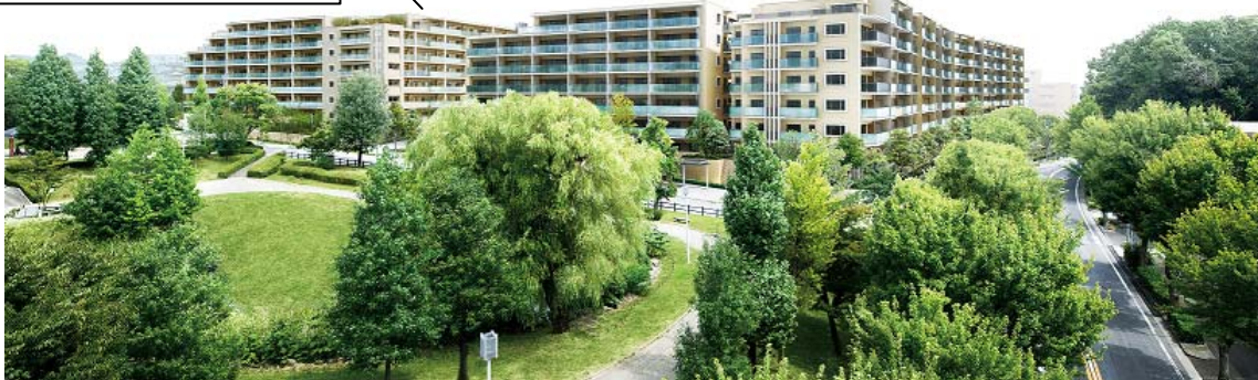
西面外観完成予想図