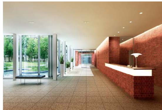
エントランスホール完成予想 CG