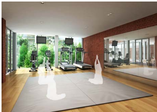
フィットネスルーム完成予想 CG