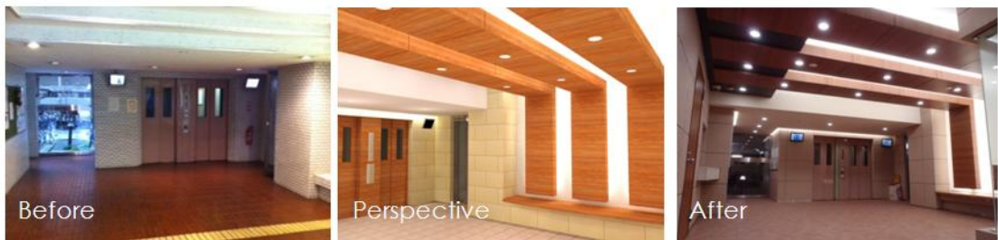
【築27年のマンション】で実現

◆このニュースリリースに関するお問い合わせ先◆ 株式会社大京 広報室（今福・河守） TEL：03-3475-3802