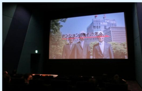
映画鑑賞会の様子 (イオンシネマみなとみらいにて)