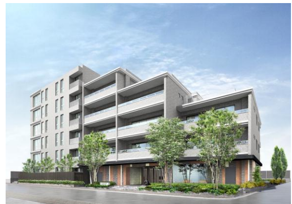
「ザ・ウェスト」建物完成予想図