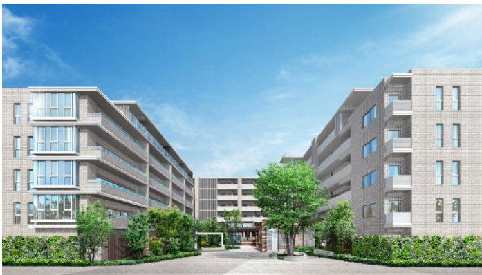
「ザ・イースト」エントランス建物完成予想図

閑静な「第一種住居地域」の住宅街の雰囲気に調和するように、エントランスを開口部に大きく向けたオープンなイメージで建物をデザインしました。また、外観は自然な風合いを持った柔らかくで優しい色彩の外観とし、低層部の外観はレンガ色・サンドベージュ・ダークグレーのタイルを縦横に模様張りして、「織物」を紡ぐように組み合わせ、ぬくもりが感じられるような建物としました。