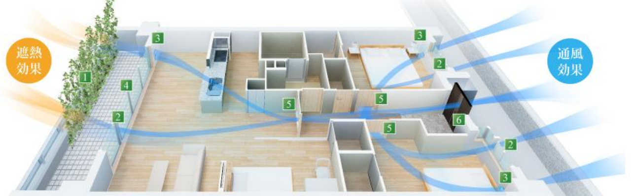
新・パッシブデザイン概念図

当社独自の「新・パッシブデザイン」を採用。外気を取り入れ、住戸内を空気が流れる「風の通り道」を作ることで、快適な室内環境を生み出します。