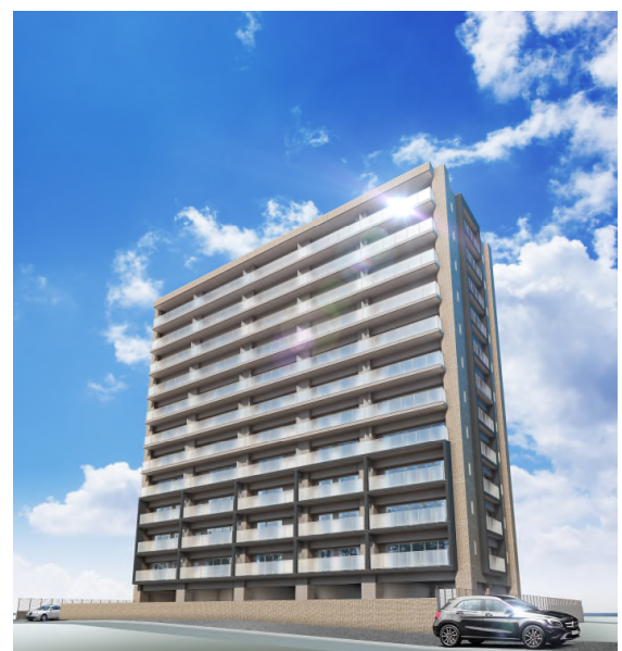
《建物外観完成予想図》