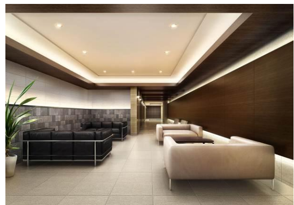
▲オーナーズラウンジ完成予想CG