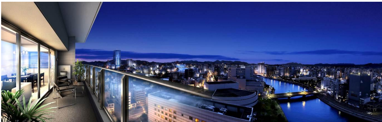
▲現地南東方向眺望 ※掲載の写真は、現地敷地内にて19階相当（約5.4m）の高さから南東方向に向けて撮影（2013年11月）したものに、設計段階の図を基に描き起こした外観完成予想図を合成し、CG処理を加えたもので実際とは異なります。また一部形状が異なる場合があります。