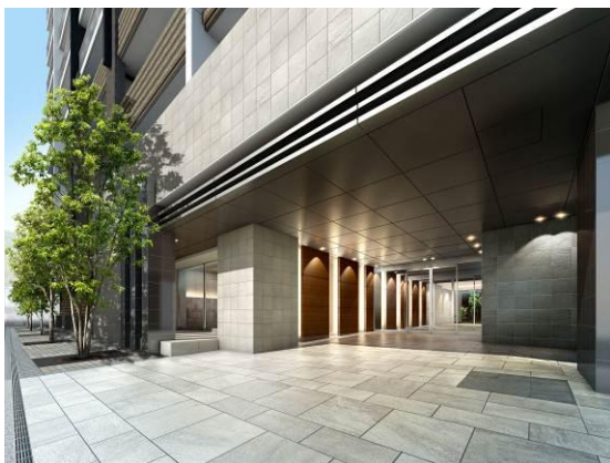
▲エントランスアプローチ完成予想CG