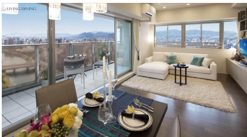
Gタイプ モデルルーム（86.01㎡・3LDK+WIC）