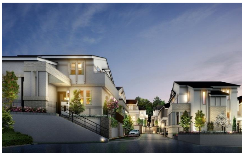
アリオンテラス玉川学園前(外観パース)

今後も「アリオンテラス」では、都市型立地にこだわったマンション開発会社ならではの都市型戸建住宅を提供してまいります。