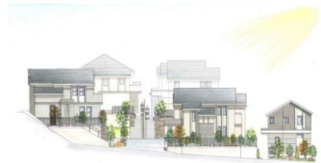
【外観デザインイメージ図】

玉川学園地域では町内会などが主体となり、良好な環境を守るための「まちづくり憲章」が制定され、さらに本物件周辺では地域住民との協議を定めた「建築協約」も設けられています。「アリオンテラス玉川学園前」はこれらに沿った街づくりを前提に、自然石を用いた擁壁（ようへき）のデザインや連続性のある植栽など、周辺の街並みとの調和に配慮しています。全 11 区画は外観で統一感のある街並みを表現しつつ、各住戸にはそれぞれ間取りで「高台にあるウッドデッキのある家」「大空間の2階リビングのある家」など個性を持たせています。