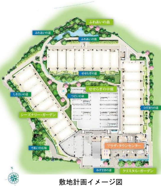
敷地計画イメージ図

「グリーンマトリックス」システムを取り入れた風景を敷地内に再現し、緑・水・光・風の自然の恵みを生かして雄大な自然環境の創出を試みました。ランドスケープはゆとりある配棟とし、ビオトープ（生物生息空間）や遊歩道を敷地内に設け、中庭や広場を有機的につなぐ緑道には約3,700本の四季を彩る植栽を施すことで、美しく調和した港北ニュータウンらしい自然風景を織りなすように計画しました。また、機械式駐車場の壁面や駐輪場の屋根などを可能な限り緑化し、敷地の緑化率を30%以上に高めました。