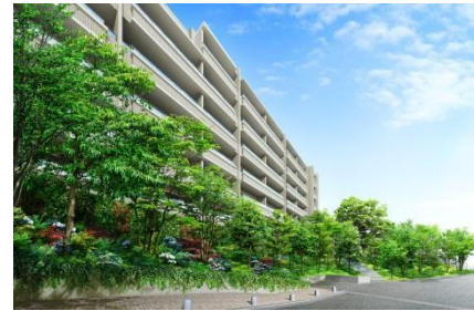
しきさいの道完成予想図

さらに、住戸はもちろん、敷地や建物計画にも水、緑、光、風などの自然エネルギーを活用するパッシブデザインに太陽光発電と蓄電池などを用いた先進のスマートシステムを融合し、省エネ、節電に取り組む新たな環境共生住宅を提案しました。具体的には、ソーラーパネルで創出された電力を蓄電池に蓄え、その電力で井戸水を汲み上げ、敷地内の植栽の水やりに利用したり、せせらぎやビオトープに利用し美しい水景を演出しています。このようにして、貴重な水資源を有効に活用し、環境の負荷を軽減する工夫を行っています。