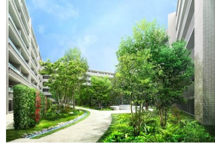
せせらぎの中庭完成予想図