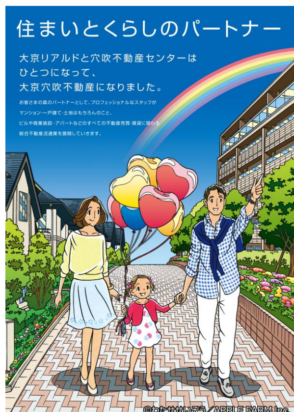
わたせせいぞう氏作イラスト

大京穴吹不動産は、安心いただける明るい未来をお客さまに提供することが使命であると考え、「住まいとくらしのパートナー」を目指し、お客さまへの約束（次ページ）を定めました。さらにパートナーとして親しみやすさを感じ取っていただけるよう、お客さまの明るい未来を願う想いを込め、美しい街並みを歩く家族のイラストを、大京穴吹不動産のイメージイラストとして、わたせせいぞう氏に制作していただきました。