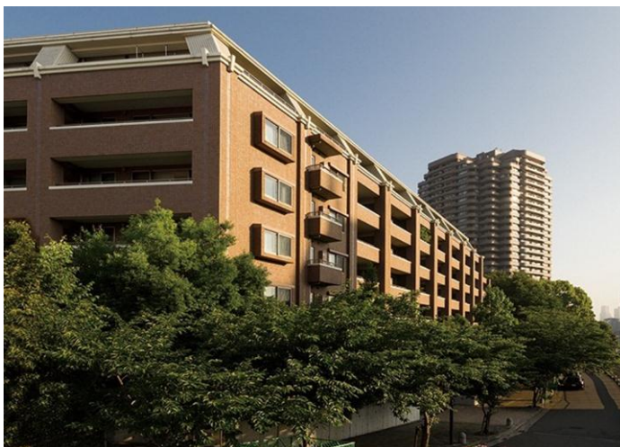
御殿山ハウス 東南側眺望写真

「御殿山ハウス」は、発展著しい品川エリアにおいて、「品川」駅徒歩圏ながら、周囲と一線を画す、落ち着いた住環境である高台の邸宅地「御殿山」に立地し、都心の利便性とプライベート感を享受できるゆとりある住空間を形成しています。この都心第一種低層住居専用地域にある「御殿山ハウス」の希少な価値を最大限に活用したリノベーションマンションの分譲を行います。