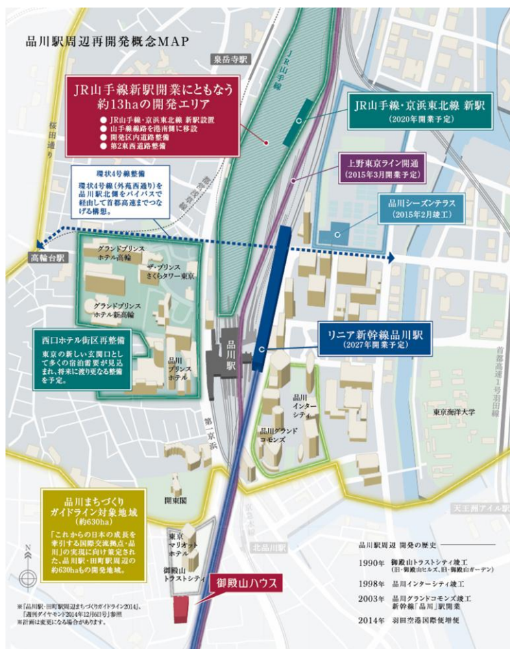
630haにも及ぶ再開発構想図