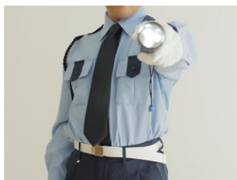
24 時間有人管理（夜間警備員）