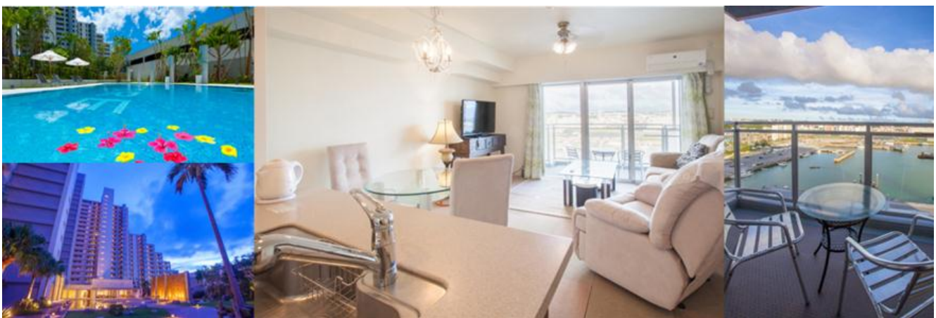
アルトウーレ美浜の外観および内観写真

ただし、オープニングキャンペーン価格であり、通常価格とは異なります。また、価格は季節によって変動いたします。