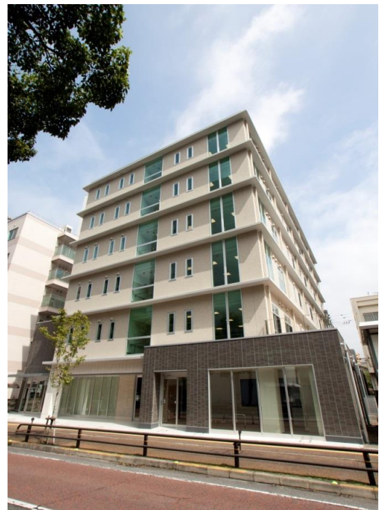
かがやきの とき 季 栗林公園

なお、本件は香川県で実績の高い介護サービスの有限会社ケア・ステーションが「ケアステーション栗林公園」としてサービス付き高齢者向け住宅を運営する他、四国・瀬戸内拠点のドラッグストア大手の株式会社レデイ薬局、中央通り脳外科・内科・在宅クリニックの協力により、香川県内最大級の高齢者向け複合施設が実現しました。