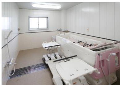
寝たまま入れる 機械式浴室