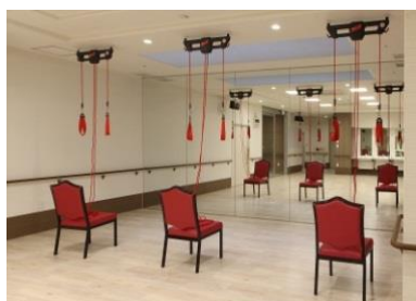
リハビリ施設 (運動療法レッドコード)