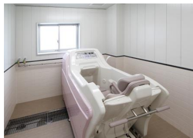
車いすで入れる 機械式浴室