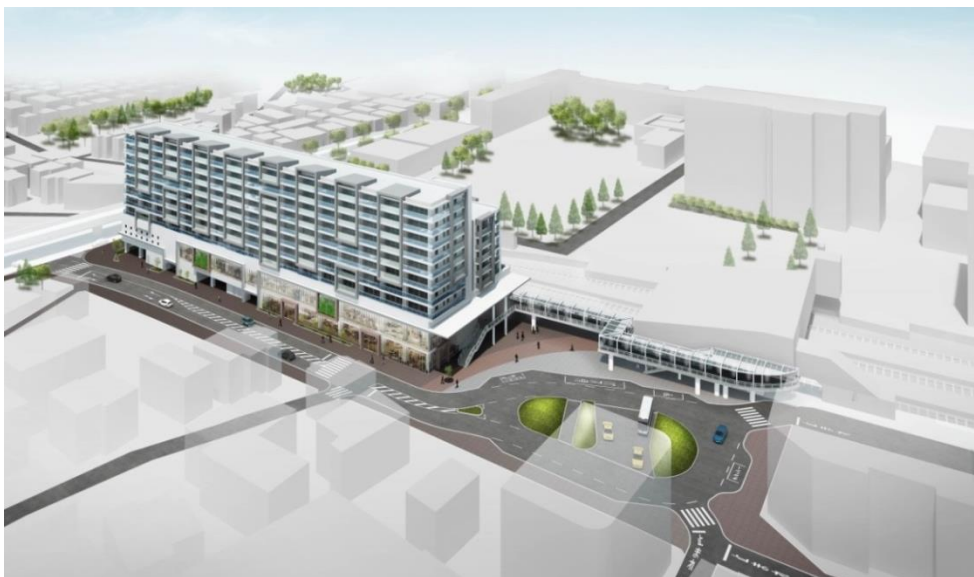
施設建築物のイメージパース

大京は当事業において、商業・公益施設・都市型住宅などの10階建て施設建築物の3～10階部分に146戸の分譲マンションを供給する予定です。都市機能の整備促進を通じて、瀬谷駅周辺の魅力とにぎわいの向上に貢献してまいります。