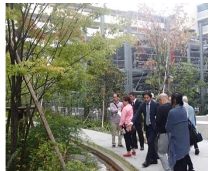
見学会当日の様子