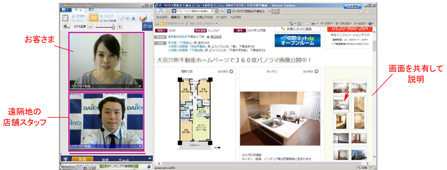
利用画面イメージ

「店舗間IT接客」ではIT重説にも対応した「MeetingPlaza」というソフトを使用し、インターネット回線を通じてお客さまと遠隔で対面接客（＝テレビ電話）を行います。