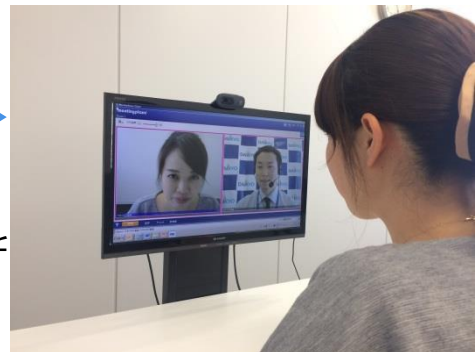
最寄りの店舗・営業所