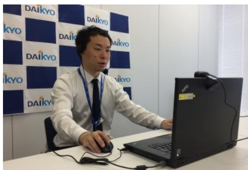
遠隔地の店舗・営業所