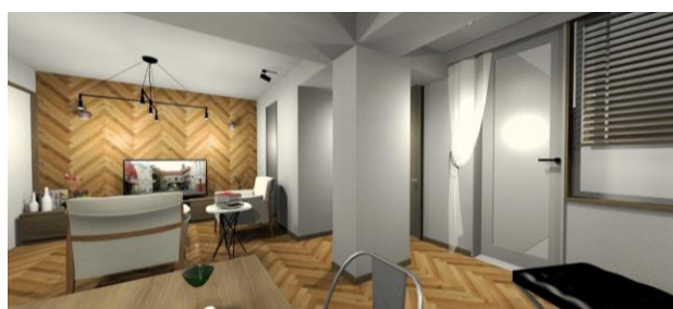
＜リフォーム後のイメージ画像＞ (バーチャルリフォーム)

少子高齢化が進行し、住宅ストック数が世帯数を上回り、空き家の増加も生ずる中、「いいものを作って、きちんと手入れして、長く使う」社会に移行することが重要であり、そのためには、既存住宅の品質・性能が、消費者にわかりやすい形で評価されることが急務で、政府は既存住宅、リフォーム市場の環境整備を進めています。（国土交通省HPより）