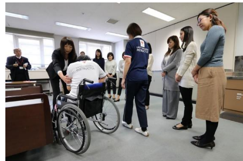
大京アステージ社員が実際に ベッドでの起き上がり介助を実践

◆ 本ニュースリリースに関するお問い合わせ先 ◆ 株式会社大京 広報・IR室（小野） TEL：03-3475-3802 日本赤十字社 広報室（森岡） TEL：03-3437-7071