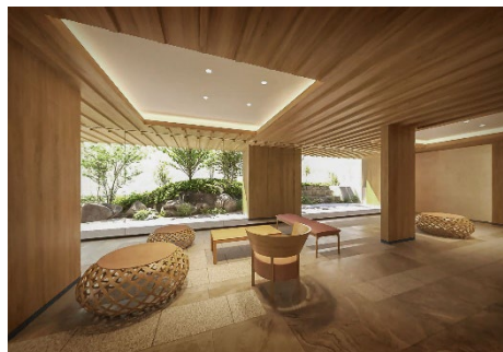
ラウンジイメージ