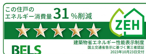
住戸の BELS 認証例 (1406 号室)