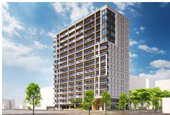
「ザ・ライオンズ札幌植物園 YAYOI GARDENS」外観イメージ