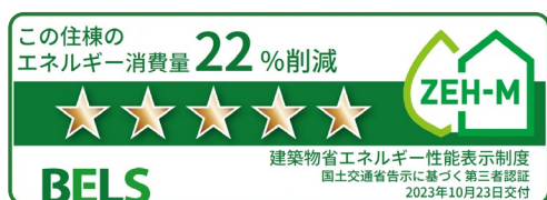
住棟の BELS 認証例

ZEH-M Oriented 仕様を採用し、住棟全体と住戸において「BELS」による第三者認証を取得しました。床、壁、天井部分に高断熱材を採用し、窓は、二重サッシを採用し、Low-E 複層ガラスを使用することで、室温の変化を押さえ、さらに、高効率設備である換気設備や高断熱浴槽、LED 照明を採用することで大幅な省エネを実現します。また、本物件は、ZEH 水準の省エネ機能に加え、共用部の一部の電力を賄う太陽光パネルや節水に資する機器を導入することで、低炭素建築物の認定を取得しました。低炭素建築物は、二酸化炭素の排出の抑制に資する建築物として、所管行政庁から認定を受けたもので、その購入者は融資や税制面で優遇措置の対象になります。