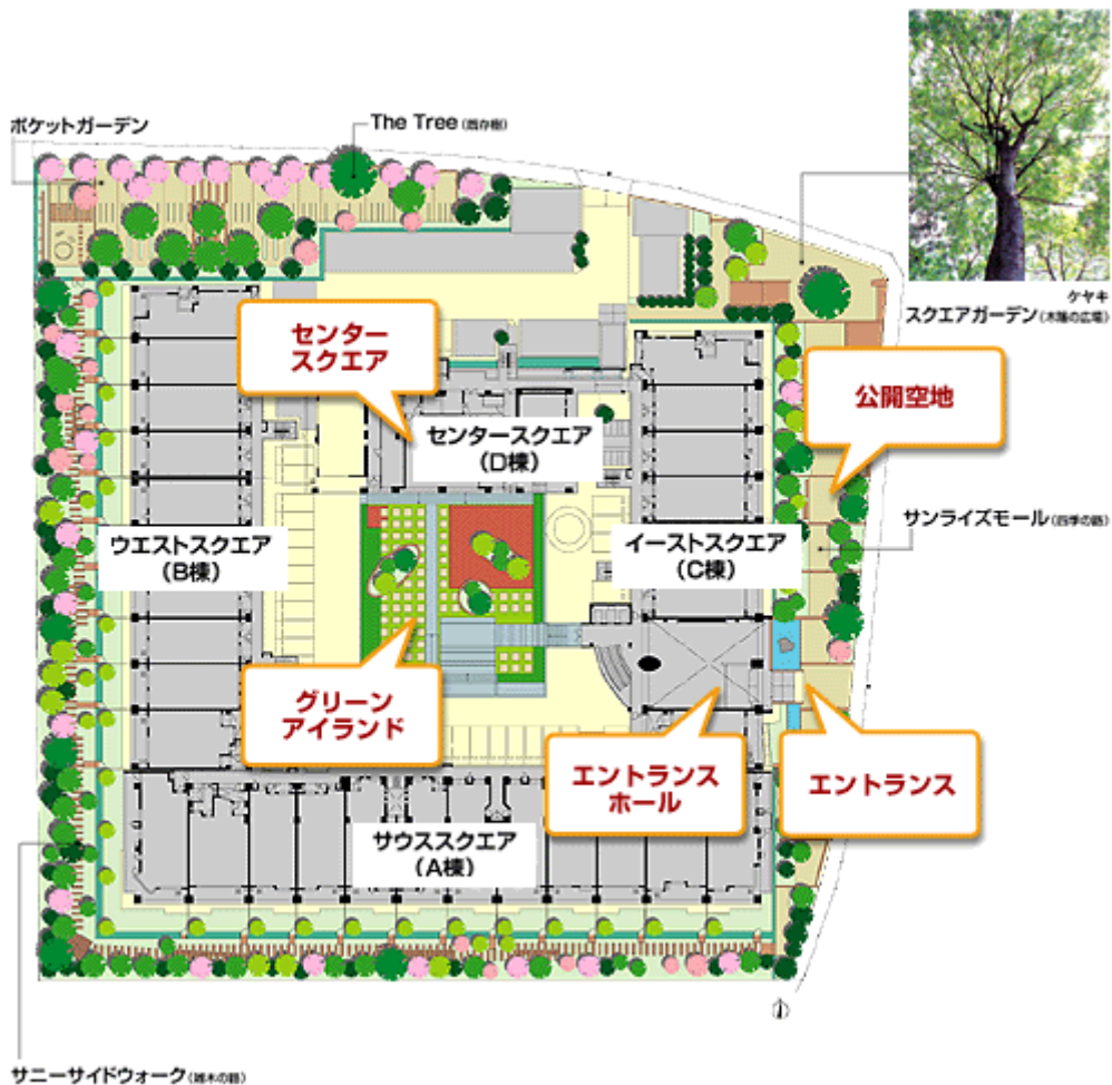
「グランアルト武蔵新城」のサイトプラン

約 12,000 m 2 の敷地の約 20%にあたる約 2,400 m 2 が公開空地となり、建物周囲は緑の遊歩道を設置するとともに、ザ・ツリーを中心に、高木・中木・低木あわせて6,600本の常葉樹や緑葉樹を配置、それとともに、高木・中木・低木（サツキ、ツツジ、サクラなど）を植栽しています。