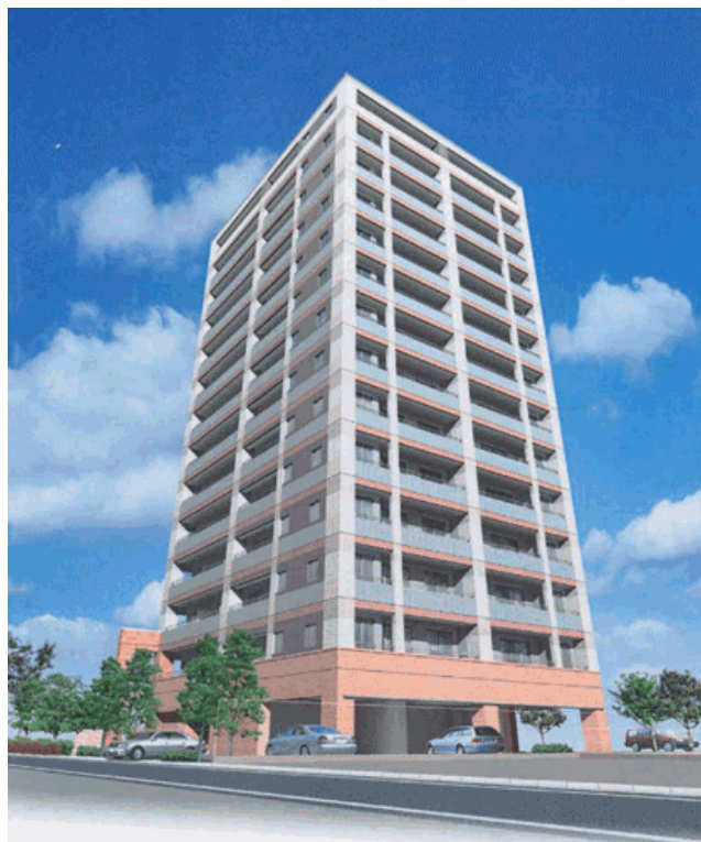
【建物外観（完成予想図）】