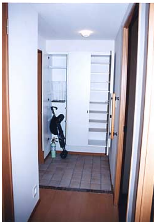
【建物写真（「LC本所吾妻橋」感電防止カバーを取り付けたコンセント）】