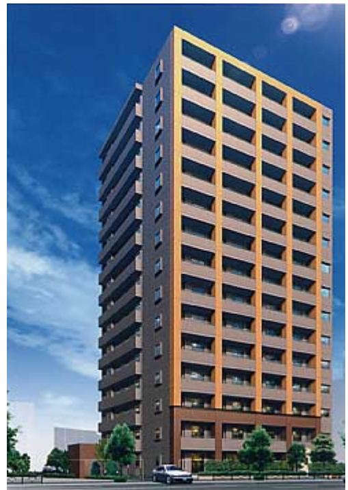
【建物外観（完成予想図）】