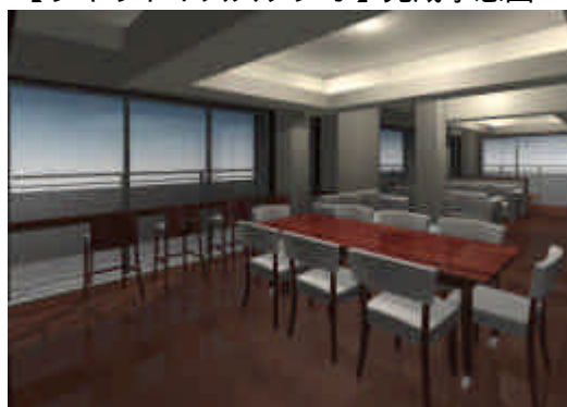
【スカイラウンジ】完成予想図