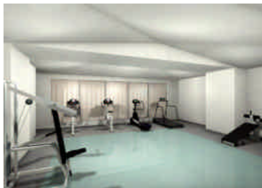
【フィットネススタジオ】完成予想図