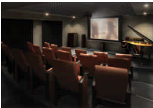
【アートスタジオ】完成予想図

「アートスタジオ」(2階)、「フィットネススタジオ」(2階)、「ゲストスイート」(2階)、「スカイラウンジ」(24階)など、大規模・超高層ならではの施設に加え、更なる安全性の向上にも配慮し、「防災センター」や「防災備蓄倉庫」も設置します。