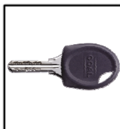
ディンプルキー(参考写真)

操作性と防犯性に優れたディンプルキーで住戸の玄関を開けます。玄関扉はダブルロックです。