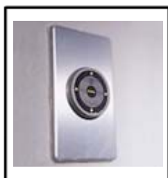
キーリーダー(参考写真)

住戸キーをパネルのキーリーダーヘッドに近づけることでロックを解除し、エレベーター操作をすることができます。 ※ボタンを押すだけではエレベーターを呼ぶことはできません。