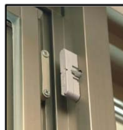
防犯センサー(参考写真)

玄関ドアや窓に設置された防犯センサー設定時に開放を感知すると、管理事務室および管理会社へ通報されます。 ※一部窓を除く