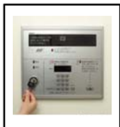
非接触キー(参考写真)