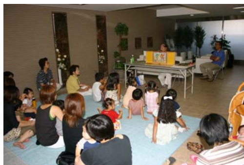
(参考写真) 既存の「子育て支援マンション」で行われた「絵本の読み聞かせ会」