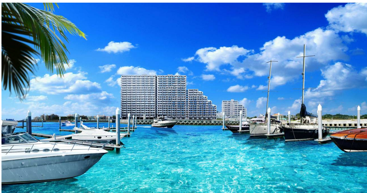
「アルトゥーレ美浜」完成予想図