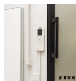
玄関・浴室・トイレに手すり