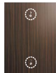
玄関ドアにダブルドアスコープ