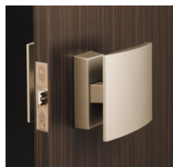
プッシュプル式ドア