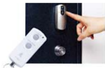
UD キーと受信機 (参考写真)

子どもや車いすの方でも楽な姿勢で来訪者の確認ができるよう、玄関ドアにダブルドアスコープを設置。