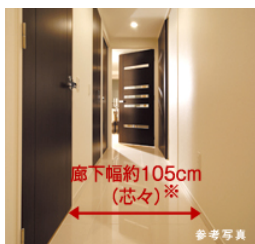
廊下幅をメーターモジュールで広く設計