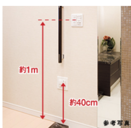
スイッチ・コンセントの設置位置