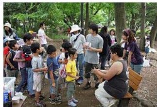
石神井プレーパークの様子