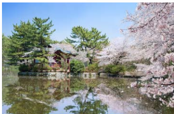
三宝寺池（石神井公園内）

また、定期的にボランティアによるプレーパークが開催され、子どもが自然の中で遊べる場としてもにぎわっています。