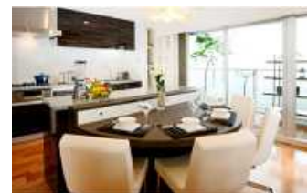
コミュニケーションダイニングの例