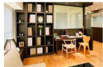
ウィズスペースの例