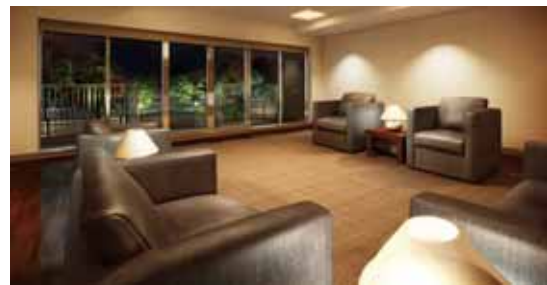
ラウンジ完成予想図