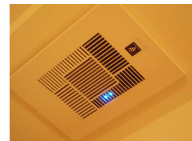
「ライオンズ光が丘オーセンティックハウス」 モデルルーム設置例