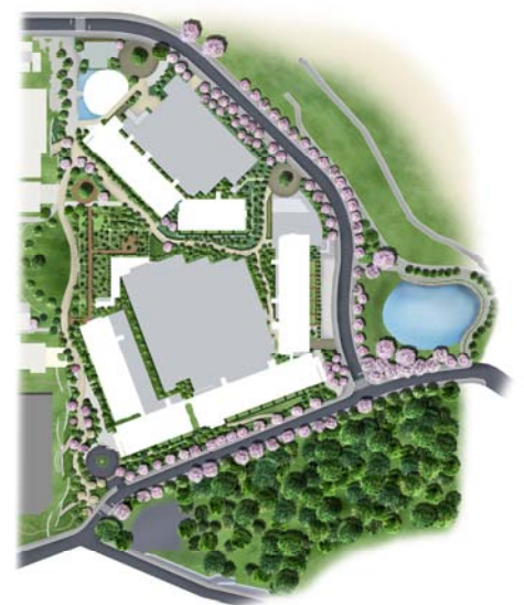
「ミリカ・ヒルズ」敷地配置イラスト