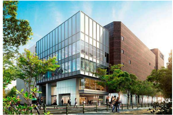
『オリックス劇場』イメージパース