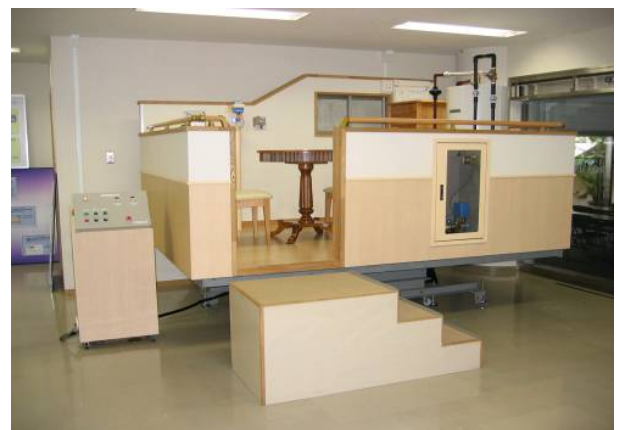
大京グループ・東京研修センターのオリジナル起震機 電気・ガス・水道の緊急遮断システムを実装しており、揺れによって弁が作動する様子を体験いただくことができます。