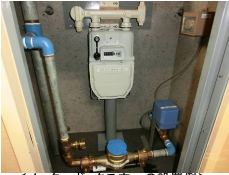
<メーターボックス内への設置例>