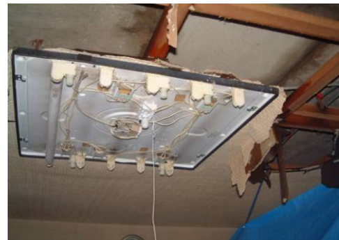
<地震による漏水被害例②>

「緊急遮断弁装置」は、多くの震災時の二次災害の恐ろしさ、被害の甚大さ、そして復旧の困難さに直面した大京アステージがその経験を活かし、震災時の被災者支援にとどまらず、被害そのものの未然防止を図りたいとの考えから、長期間に亘る試行錯誤によって生まれた給水設備の安全装置です。