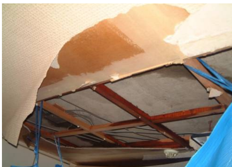
<地震による漏水被害例①>

この時に、避難等で不在であり、かつその供給ラインの一部に損傷があった場合には漏水が発生することとなり、居住者や管理員による発見が遅れて階下の多くの住戸に被害をもたらしてしまっても、多くの場合は保険適用とならないのが現状です。