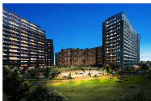
ウェルカム! プラザ