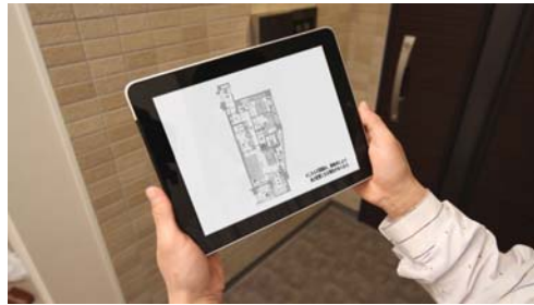
AR (拡張現実) 2012年5月導入