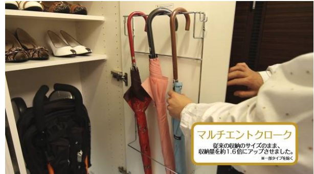
②玄関（下足入の機能性を確認）