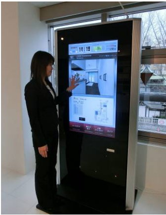
デジタルサイネージ (2012年2月導入)

ありのままに知覚される情報に、CGにより作られた情報を付加し、「実現認識を強化」する技術のAR (Augmented Reality:拡張現実) を採用しました。目の前の映像に、CGオブジェクトを重ね合わせてさまざまな表現を映し出すことができます。