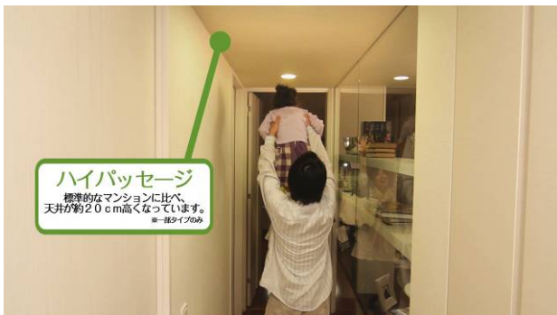
③廊下（廊下の高さの確認）