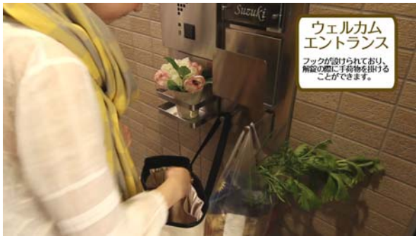
①ウエルカムエントランス