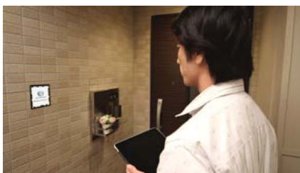
8カ所の「AR マーカー」があります