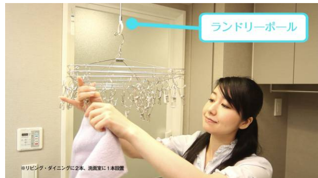
④洗面室（洗面室での生活イメージ）