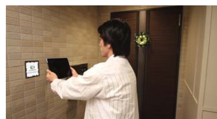
「AR マーカー」に iPad をかざします