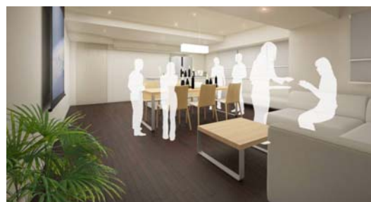
スーパリアスイート