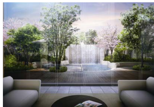
オーナーズ・ガーデン