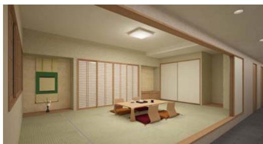
ジャパニーズスイート