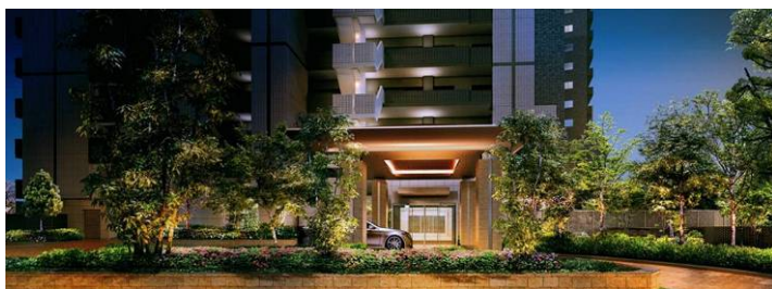
②ウェルカムゲート