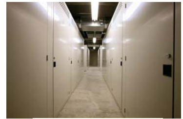
共用トランクルーム