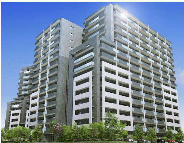
「ライオンズ プレティナ レジデンス」外観完成予想図