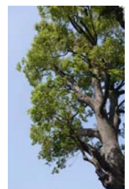
③ハートフルガーデンと樹齢約百年の保存樹「楠」