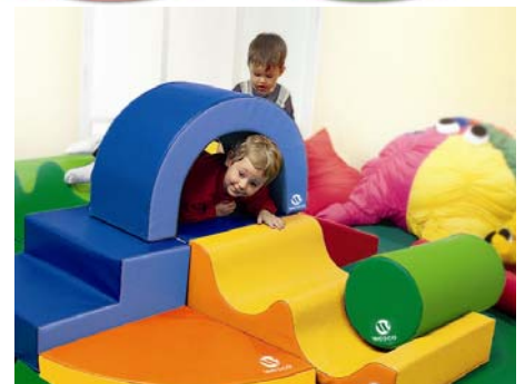
キッズルーム（イメージ）