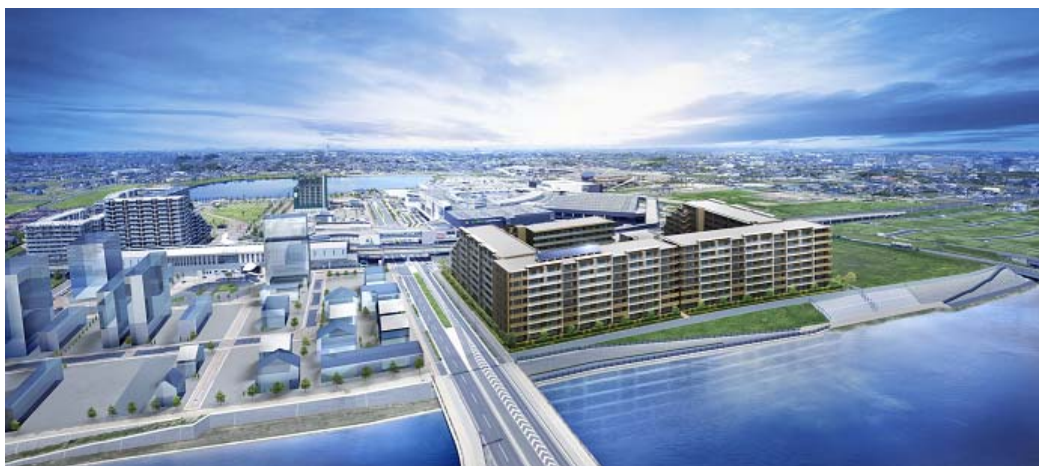
グランアルト越谷レイクタウン外観完成予想図

具体的には、日常から世界につながる多彩な共用施設を備える他、コンシェルジュカウンターにバイリンガルスタッフを起用したり、コミュニティ内に英会話教室を導入したりするなどのソフトサービスを予定し、暮らしながら英語や国際感覚が身につく子育てを支援します。