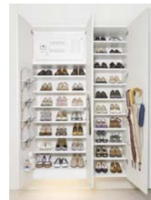
マルチエントクローク

「たっぷり・すっきり・自在」をテーマに開発した玄関収納。従来の収納サイズをほとんど変えずに、設計とレイアウトを見直すことで靴の収納量をアップさせました。