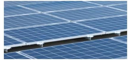
太陽光発電システム（イメージ）

共有部の一部への電力供給を実現、環境にも経済的にもやさしい「太陽光発電システム」を採用。