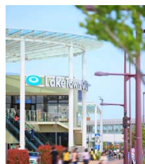
イオンレイクタウン