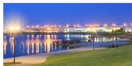
環境共生都市（水辺）