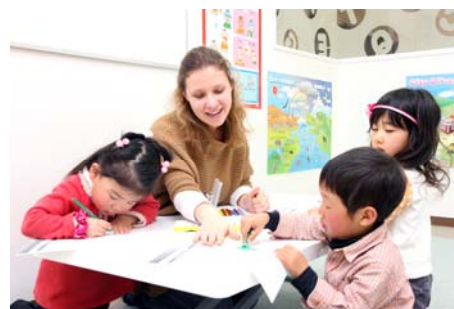
子供英会話教室（イメージ）

※2 サービス内容は、一部変更になる場合があります。 ※2 利用条件・使用料等は管理規約によります。