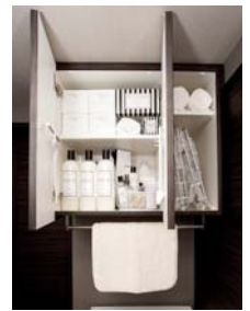
ランドリーキューブ

洗濯機上のデッドスペースを有効活用し、さまざまな洗濯グッズのサイズを測定し生まれた、洗濯作業をもっと快適にするための洗面室収納です。