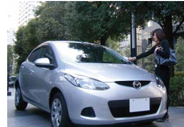
カーシェアリング（イメージ）

1 台の自動車を多数のご家族で共同利用する会員制のカーシェアリングサービスです（有料）※4