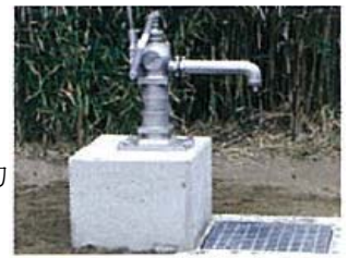
防災井戸参考写真