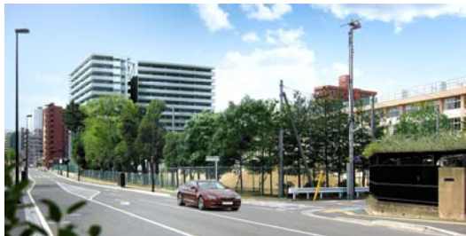
上記3点：外観完成予想図