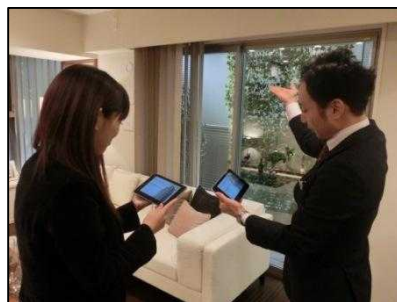
同じ動画でご説明