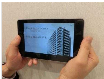
小型タブレットを導入