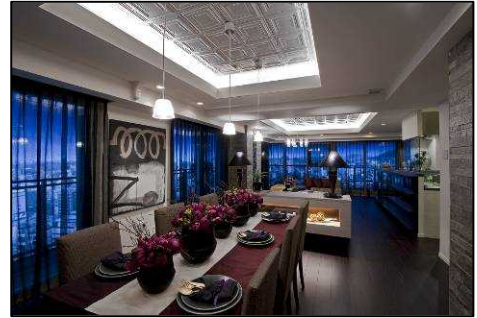
グランドエントランス