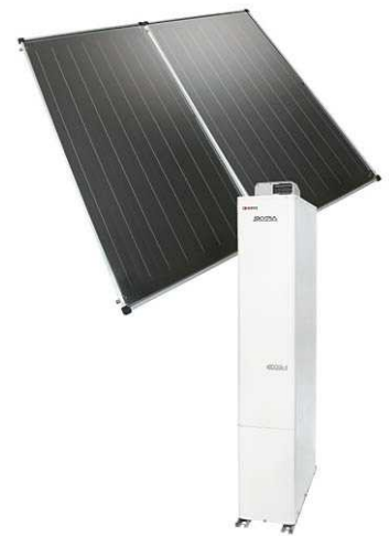
パネル&貯湯ユニットイメージ写真