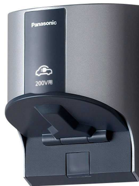
カーコンセントイメージ写真