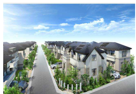
(仮称)三鷹市大沢三丁目計画のイメージイラスト