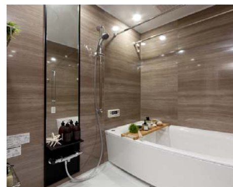
「ラピタス 31 西宮」 Reno α（リノアルファ）モデルルーム 上：リビングダイニング、 右上：キッチン、 右下：バスルーム