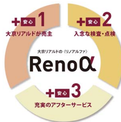
Renoα（リノアルファ）の 3 つの安心がもたらす+αの生活空間