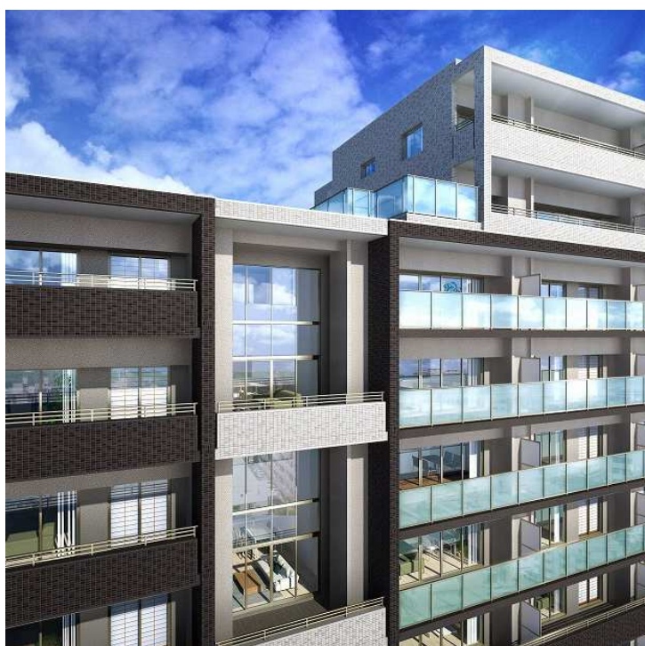
サーパス今泉陽北テラス完成予想図